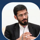
دکتر عبدالرسول علم الهدی